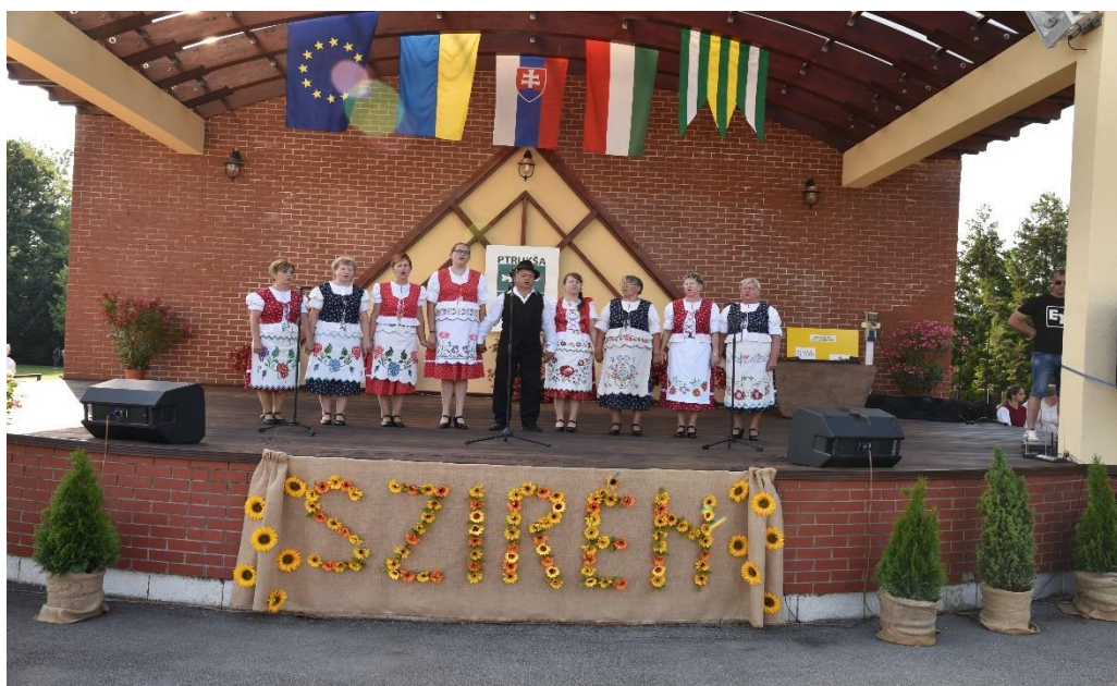
Obrázok č.5 Prírodný amfiteáter