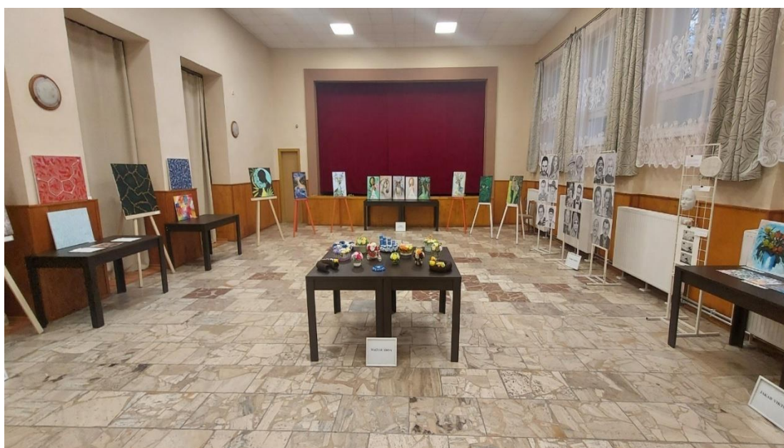
Obrázok č.6 Kultúrny dom

Kultúrny dom v súčasnosti zabezpečuje kultúrno-spoločenské požiadavky širokej vrstvy obyvateľov obce a tak zastáva kľúčovú úlohu pri organizovaní významných kultúrnych podujatí. Fungujúca kultúrna infraštruktúra je dôležitá pre sociálno-ekonomický rozvoj regiónu, pretože poskytovaním adekvátnych priestorov na konferenčné, prednáškové, kultúrno-spoločenské a iné účely sa dosiahne vyvážený regionálny rozvoj prostredníctvom zvýšenia konkurencieschopnosti obce.