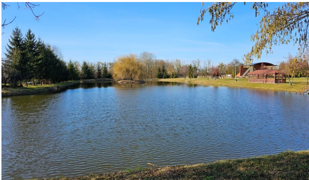
Obrázok č.3 Kultúrno – rekreačná zóna na brehu jazera Palagča

Jedinečnosťou obce Ptrukša je Lengőhíd (Hojdací most) nad riekou Latorica, tvoriacou juhozápadnú hranicu obce, ktorý spája Použie s Medzibodrožím a dáva možnosť turistom i cykloturistom na skrátenie trasy medzi susednými regiónmi.