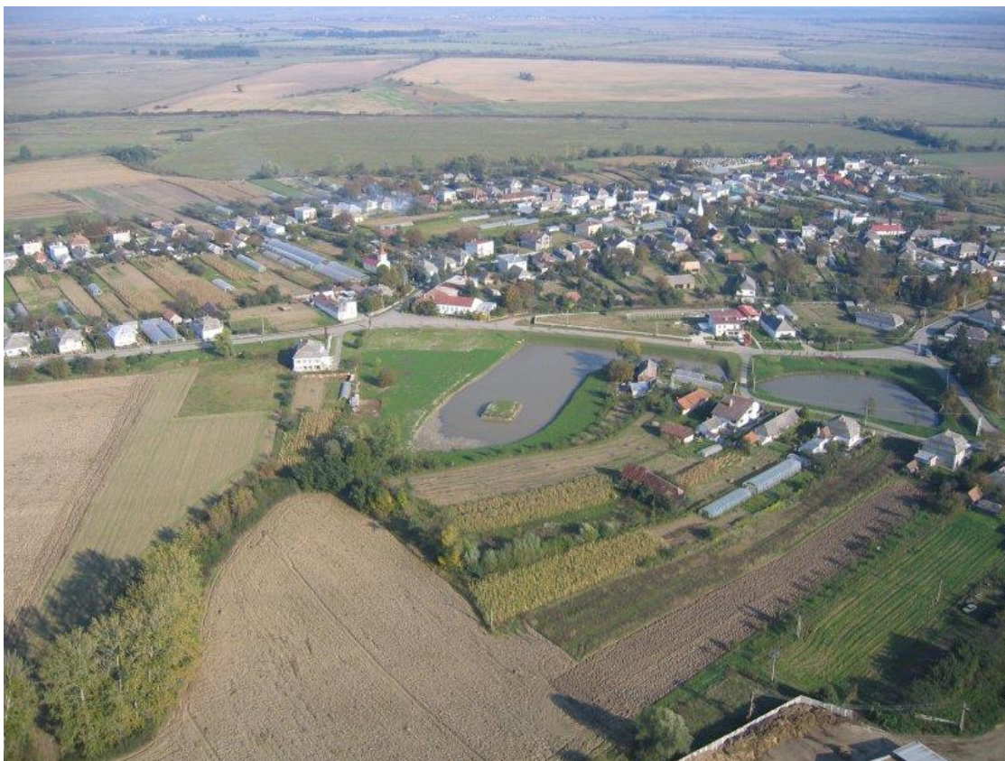
Obrázok č.1 Obec Ptrukša z vtáčej perspektívy