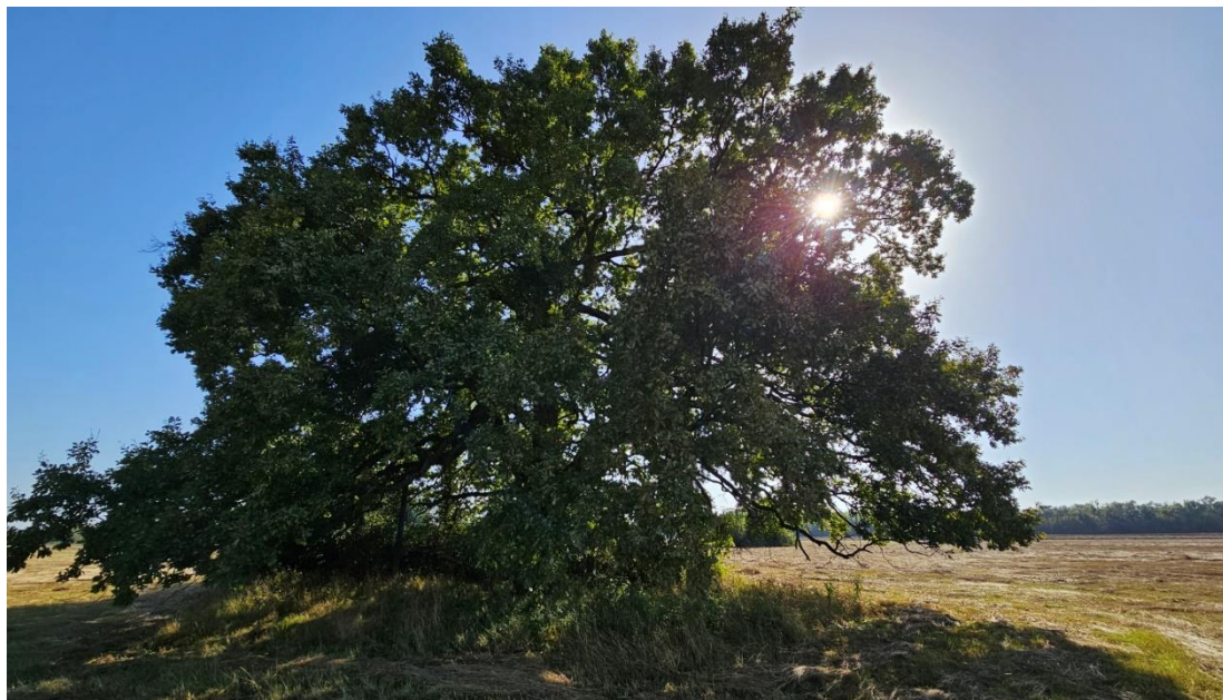
Obrázok č.7 Dub matuzálem v medzihrádzovom priestore Latorice

Košický kraj sa rozprestiera na juhovýchodnom území Slovenskej republiky na hranici s Ukrajinou a Maďarskou republikou. Na západe hraničí s Banskobystrickým krajom a na severe s Prešovským krajom. Košický kraj tvorí 11 okresov: Košice I, Košice II, Košice III, Košice IV, Košice-okolie, Michalovce, Rožňava, Trebišov, Spišská Nová Ves, Gelnica a Sobrance. Kraj má 438 obcí, 6 okresných miest a 17 sídel so štatútom mesta. Z hľadiska orografie je región výraznejšie členitý. V kraji sa nachádza najnižší bod republiky — Klin nad Bodrogom v blízkosti hraníc s Maďarskom vo výške 93,8 m n. m.